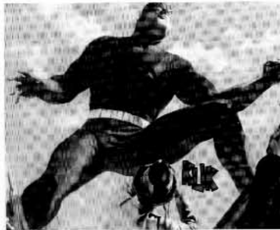
Kurt Busiek ja Alex Ross: Marvels EGMONT

Supersankari-sarjakuvat keskittyvät ihmeseen, joka tekee ihmisestä yli-inhimillisen. Kun henkilö saa supervoimat, hän alkaa tarkkailla kehossaan tapahtuvia muutoksia kuin murrosikäinen. Uudet piirteet vauhdittavat kasvua aikuiseksi, vastuun kantavaksi sankariksi.