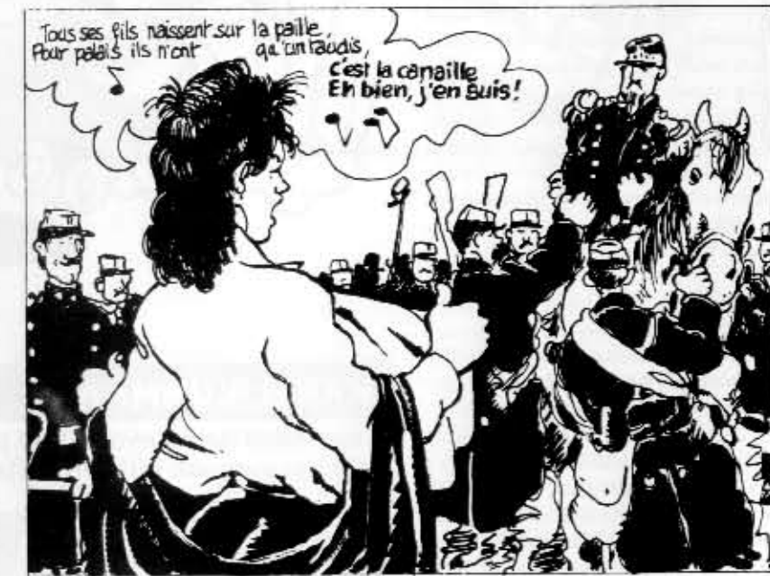
Tardin albumi Le Cri du Peuple: Les canons du 18 palkittiin Angoulêmessä.

Viime vuoden suurimpia myyntimenestyksiä olivat Uderzon Asterix ja Traviata (3 000 000 kappaletta), Benoîtin ja Van Hammen L'Étrange rendez-vous (458 000 v. 2001, yht. 500 000) Torne & Janryn uusi Pikku Piko -albumi (375 000 v. 2001, yht. 600 000). Kiinnostavin ilmiö on kuitenkin ranskalaisen lastensarjakuvan uusi nousu uuden kassamagneetin vetämänä: Pikku Pikon ja vanhoja Asterixeja selvemmin lapsille suunnatun uuden Asterixin lisäksi 20 myydyimmän albumin listalta löytyy peräti seitsemän