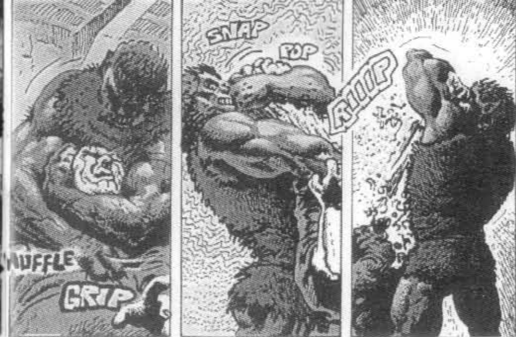
The Beast of Wolfton