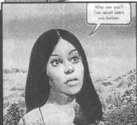
The Spirit of the Beast