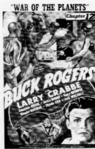
Buck Rogers oli Tarzanin ohella ensimmäinen seikkaileva sarjakuvassankari.