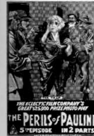
The Perils of Pauline (1924).

Maailman ensimmäinen todellinen jatkuvajuoninen sarjafilmi oli The Perils of Pauline (1914), jonka pääosassa oli legendaarinen Pearl White (1889–1938), hurjapäinen neitonen, joka loikki pitkin kattoja naamioituneita kintereitä, kiipeili paloportaita, putoili salalukuista, hyppäsi sillalta veteen ja oli välillä jopa kahlehdittuna ratakiskoihin junan lähestyessä tai pöytään sidottuna pyörivän sahanterän edessä. Ja tuohon aikaan ei vielä käytetty sijaisnäyttelijöitä.