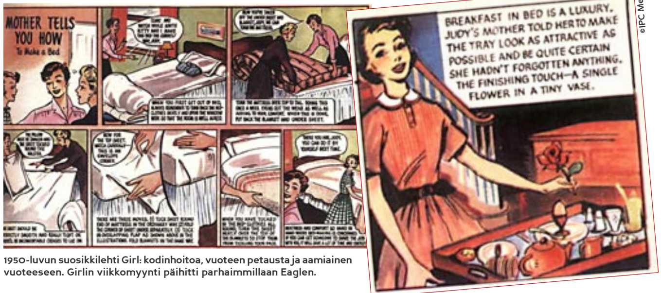
1950-luvun suosikkilehti Girl: kodinhoitoa, vuoteen petausta ja aamiainen vuoteeseen. Girlin viikkomyynti päihitti parhaimmillaan Eaglen.

Eaglen sisarjulkaisu, ulkoasua myöten, oli vuonna 1950 aloittanut simppelellä nimetty Girl. Pojille