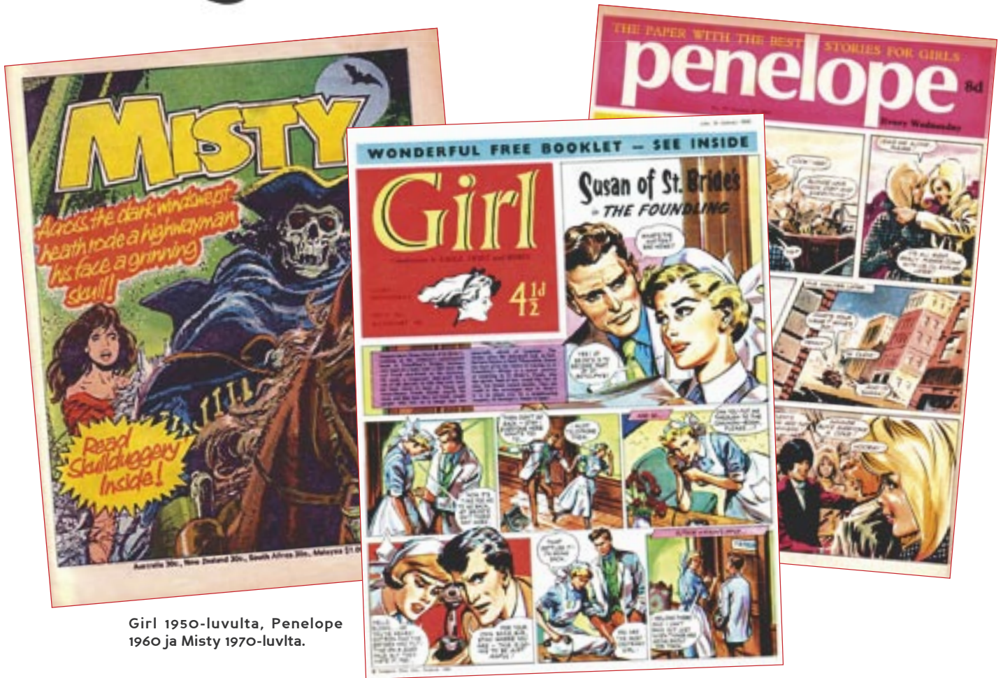
Girl 1950-luvulta, Penelope 1960 ja Misty 1970-luvulta.