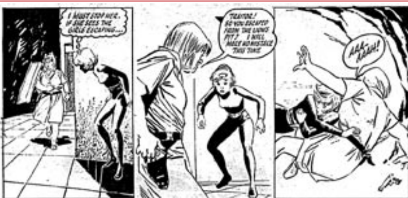
Ylh: Sally 15.11.1969. Legion of Super Slaves. Tamara kohtaa julman aivopesukouluttaja Gertan. Vas: Toisen maailmansodan aikaan sijoittuvan sarjan nimessä on samaa kaikua, Tammy 1971.