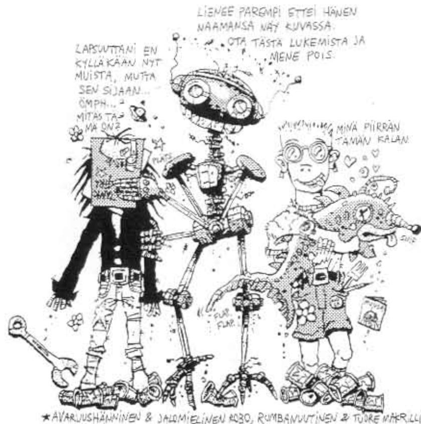
*ÄVARJUSHÄNNINEN & JALMIELINEN ROBO, RUMBANNUUTINEN & TOURE MÄKILLÄ.