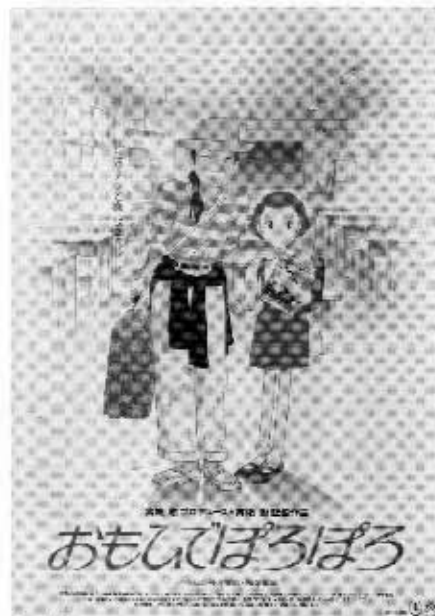
Omoide poro poro

Tyttöille ja naisille on omat saippuaopperaa ja romanttisia teinilukemistoja hyödyntävät animensa, joihin myös usein sekoitetaan fantasia- ja seikkailukertomuselementtejä. Koulutytöanime-kuningatar puolestaan on tällä hetkellä Chibi-Maruko-Chan , tekijänsä Momoko Sakuran 70-luvun lapsuudenmuistoja hyödyntävä TV- ja elokuvaanimaatio, jossa itsepäinen alakoulun kolmasluokkalainen tyttö elää normaalin japanilaisperheen ja pik-