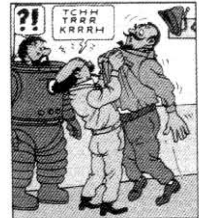
Professori Tuhatkauno suivaantuu vartijalle albumissa Päämääränä Kuu.