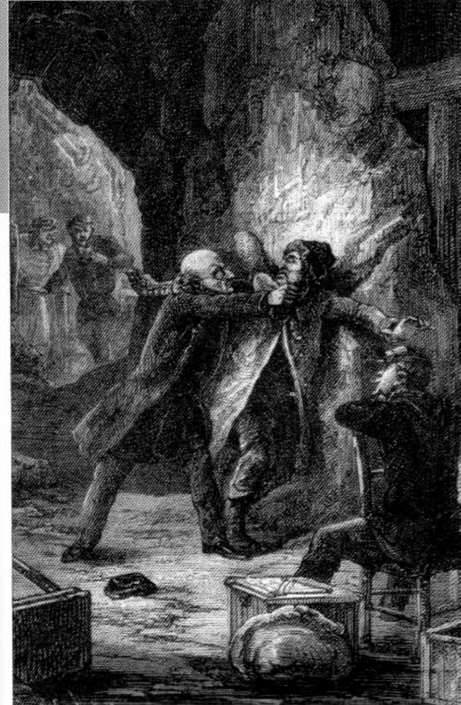
Professori Rosette Hector Servadac'n avaruusmatkasta.