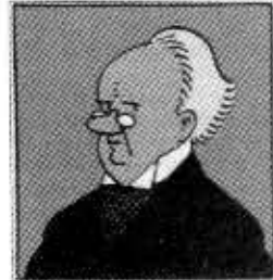
Kaksi Schultzia Jenasta.