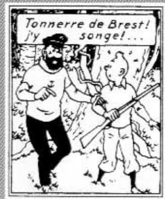
Haddock ja Tintti Rakkham Punaisen aarteessa.