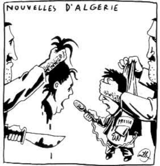
Neijännen valtiomahdin toimintaa ei estä mikään.

- Ehkä minun pitäisi tehdä juttuja vielä enemmän tilanteista. Se on kuitenkin ehdottomasti vaikeampaa. Asioita on helpompi käsitellä, kun ne hontaloit. Lisäksi ihmiset ymmärtävät henkilöitä huumoria paremmin."