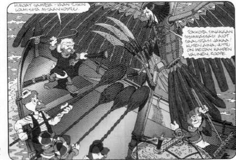
Don Rosan versio Akseli Gallen-Kallelan maalauksesta Sammon puolustus.

"Japani punoa tarinoihini lukemattomia sivujaonia on peräisin 50-luvun lopun Madeista. Niistä opin periaatteen, että en voi antaa lukijalle täyttä tyydytystä, jos eri tarinanpätkät ja sivujuonet