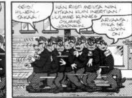
Teknologia on rakennusinsinööri Rosan mieleen.