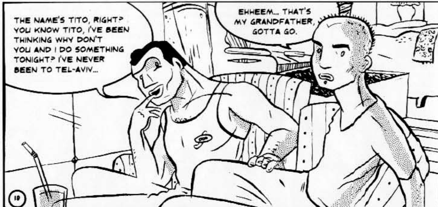
© Y. PINKUS: THE SISTERS D'ESPARD

Netistä tiedot löytyvät osoitteesta: http://members.xoom.com/puce_moment/sar-tap.html