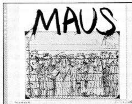
Ensimmäinen 3-sivuinen Maus-tarina, jonka Spiegelman teki Funny Animals -lehteen vuonna 1972.

Sähkö-Mausia voi olla hankala löytää. Kustantamo on mennyt nurin, eikä maahantuojien varastoissakaan hiiriä enää ole. Ensimmäisenä kannattaakin ehkä suunnata kohti kirjastoa. ■