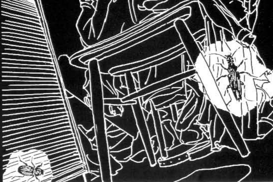
Marko Turunen - Annemari Hietanen: Normal #2.

Stretchin tarinat ovat 1960-luvun lännensarjoista. "Kirjoitin ylös sopivia kohtia ja muokkasin niistä oman tarinani", Turunen kertoo. Lutikoiden ja muiden ötököiden valtaamaa kotia kuvaava Panorama of Home Sweet 43,5 m 2 on tehty kopiomalla huoneiden kuvat negatiiviksi ja liittämällä niihin positiivikuvat Hietasen piirtämistä ötököistä.