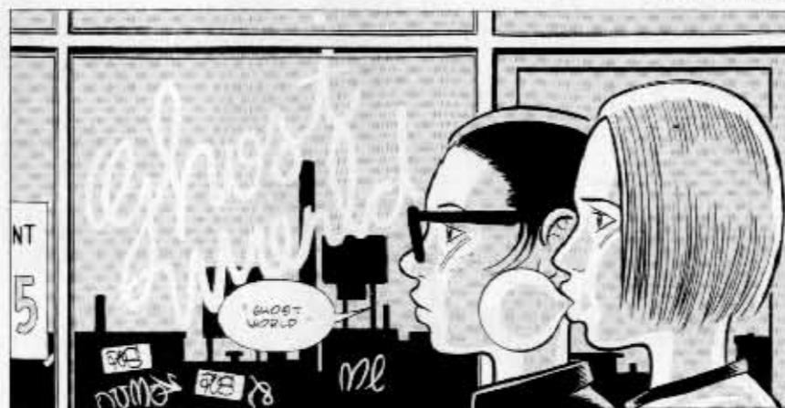
Ghost World ilmestyy vihdoinkin suomeksi.

Chris Waren toinen sarjakuva-albumi, Quimby the Mouse, ilmestyy heinäkuussa. Näillä näkymin helmikuussa 2003 puolestaan näkee päivänvalon Acme Novelty Library #16, jossa Ware aloittaa eri amerikkalaisiin kaupunkilehtiin piirtämänsä Rusty Brown -tarinan julkaisemisen lehtimuodossa. Muista Waren sarjakuviin liittyvistä projekteista mainittakoon graafinen suunnittelu Drawn & Quarterlyn tuluviin Gasoline Alley -kokoelmiin sekä Fantagraphicsilta huhtikuussa ilmestyneeseen Crazy Kat #10 -albumiin, johon on koottu vuosien 1925-1926 sarjoja. Eclipsen konkurssin jälkeen Fantagraphics otti vastatakseen Crazy Katin täydellisestä julkaisemisesta albu-