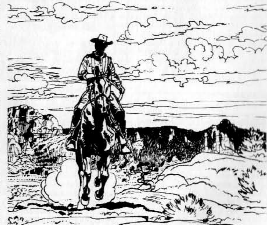
Val Kilmer näyttää luutnantti Blueberryä.