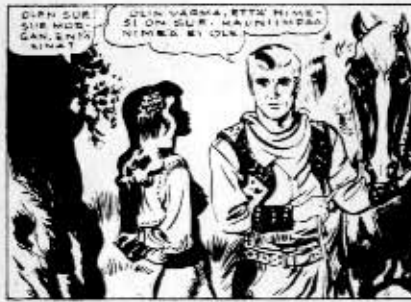
Pecos Bill taltuttaa tamman.