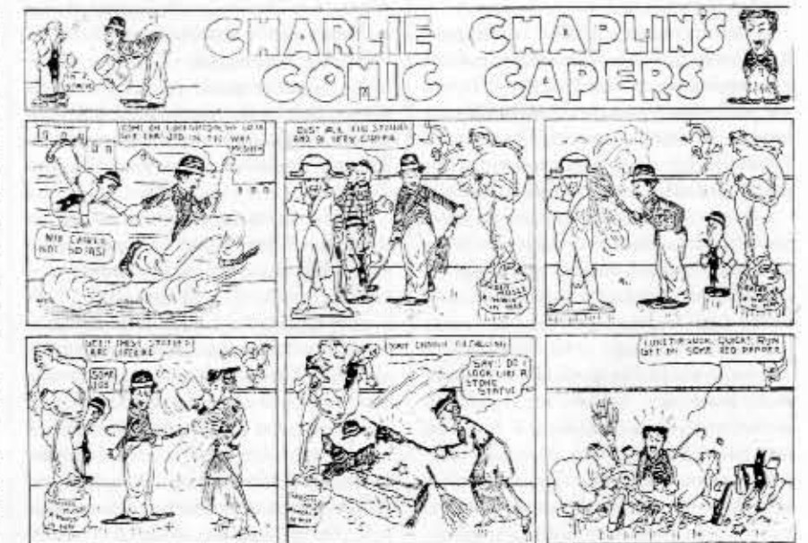
Yellow Kidin luoja R.F. Outcault rohka isi Elzie C. Segaria ryhtymään sarjakuvapiirtäjäksi. Alku aina hankalaa.