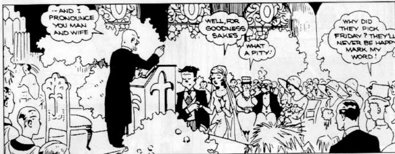
Helmin ja Heikin häät. Chic Youngin luoman pariskunnan yhteiselosta tehtäisiin kolmisenkymmentä elokuvaa.