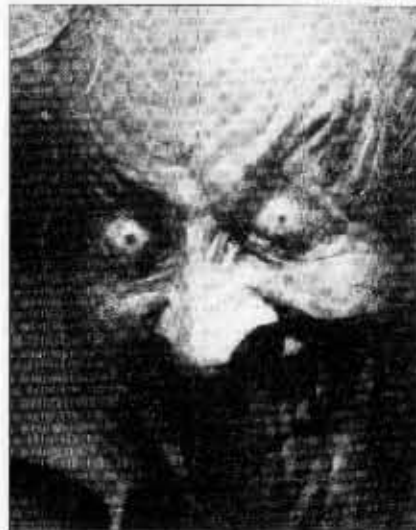
Arkham Asylum (1989).

– Etsin valokuvista tarinoita, niistä löytyy aina jotakin uutta. Kerään runsaasti kuvia sieltä ja täältä, kaikenlaisista tilanteista. Muokkaan niitä tietokoneella ja mielikuvituksellani. Yhteen kuvaan voi upota jopa 20 valokuvaa. Kuvia voi muunnella rajattomasti, lopullisen version lukitsemista voi venyttää pitkään. Joskus epäroin, onko se hyvä juttu, pohtii McKean.