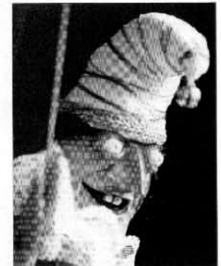
Unenomainen Mr. Punch on Gaimanin ja McKeanin yhteistyön kirkain helmi.