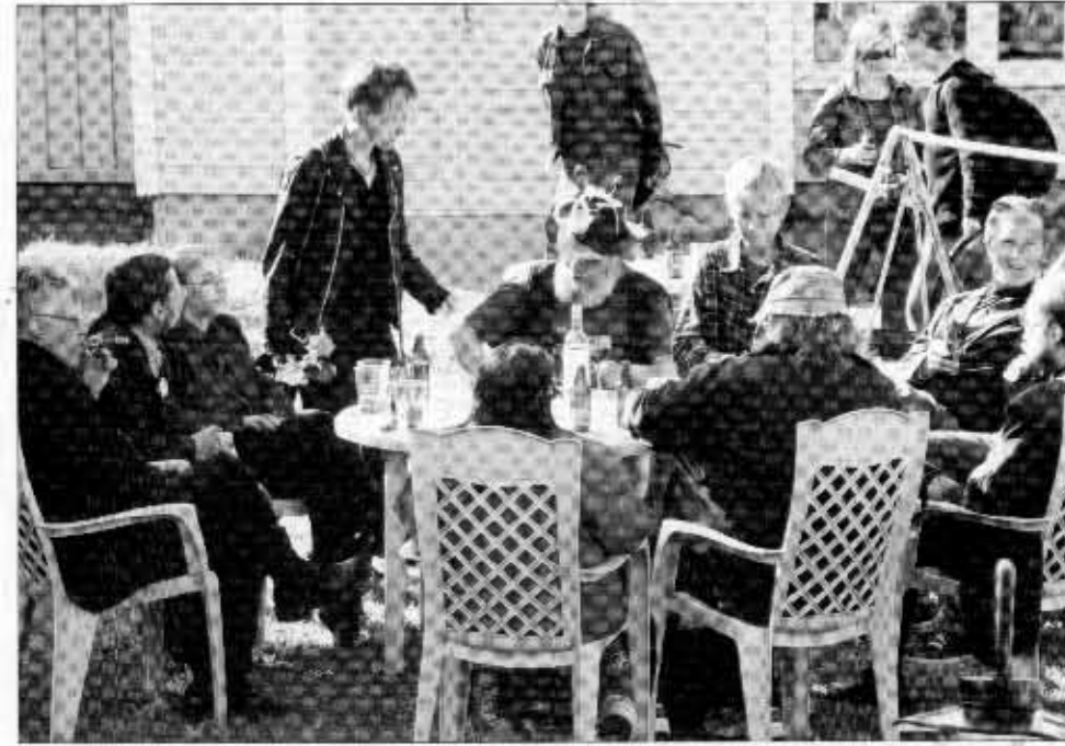
Loppukaronkka keräsi väen yhteen jänkälässä.

Naiset jyräävät sarjakuvissakin -panelissa sarjakuvakilpailussa menestyneet naiset kertoivat sarjakuvistaan. Nuoremmat tekijät mainitsivat idoleinaan hieman yllätyk-