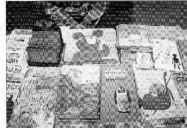
Lilliputtikustantajat eivät ole hylänneet Kemiä.