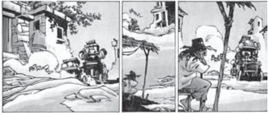
Abolinin, Pontin ja Chagnaudin sarjassa ajellaan verkkaisesti.

Kyse ei ole niinkään sarjakuvien laadusta. Ratian maku on hyvä, ja kokoelmaan valikoidut ulkomaiset ja kotimaiset sarjat