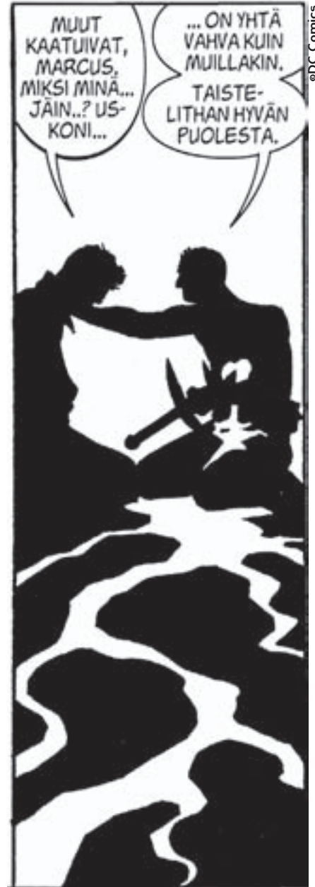
Henkimaailmassa taistellaan jälleen.

Samaan saumaan iskee, joskin paljon roisimmin ja humoristisemmin, Peter Tomasin ja Peter Snebjergin DC:lle tekemä Valon prikaati, jonka Egmont on pistänyt ulos suomeksi Henkimaailman korkeajännitys-nimisenä yksittäisjulkaisuna. Tarina on huima ja ottaa vauhtia selvästi gnostilaisista uskomuksista ja juutalaisesta kabbalasta, joissa enkeleitä, puolienkeleitä ja puolijumalia on enemmän kuin ”normaalissa” kristinuskossa. Täyttä selvyyttä ei ole