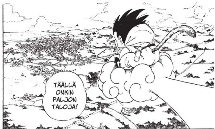
Häntäveikon lentovälineenä on pilven tapainen Kin-To-Un.

Zetan lisäämisen syynä oli myös se, että Toriyama halusi kertoa vakavampia ja toiminnallisempia tarinoita. Hahmojen joukossa on edelleen myös nuoria, mikä säilytti mukana sarjan alkujaksojen lapsekkaan innostuneen huumorin.