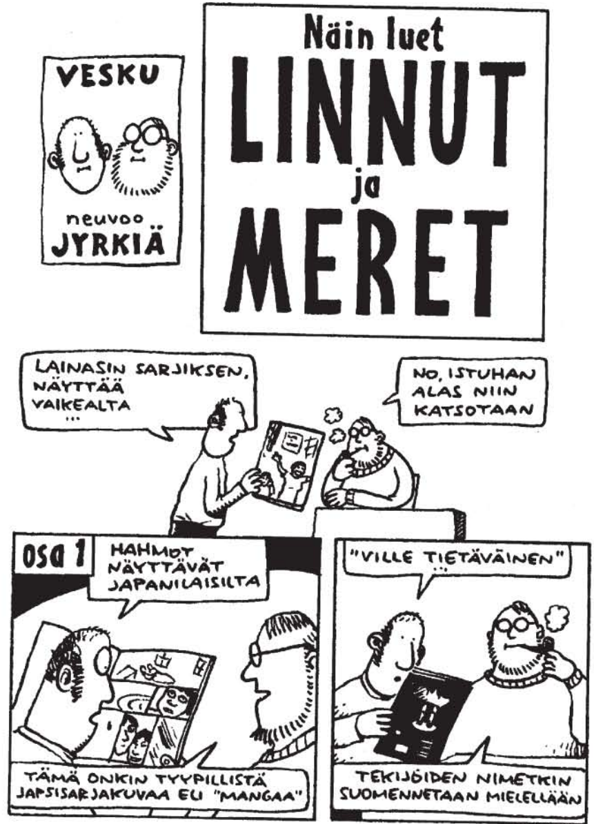
Valittujen Sarjojen sarjakuvavalistusta.

Seiniä päin -sarjakuvia ei voine luonnehtia stripeiksi, sillä lyhyistä sarjoista puuttuvat varsinaiset vitsit. Ne ovat kuitenkin tehty tuttuun kolmi- ja neliruutuiseen formaattiin.