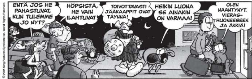
Kollegat tulevat onnittelevierailulle Touhuloille.