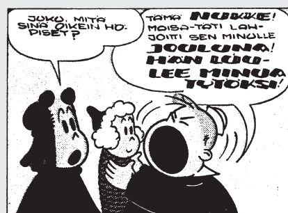
Tumppi tekee kaikkensa päästäkseen eroon nukestaan.