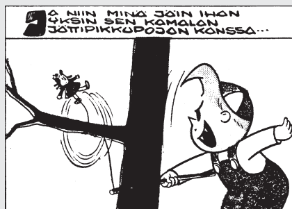
Pikku Lulu kertoo merkillistä satua.

Useissa episodeissa Pikku Lulu pysyttelee hyvin realistisissa puitteissa. Näissä tarinoissa ei edetä kotia, koulua ja lähikauppaa kauemmas. Koko ajan mukana on mahdollisuus siihen, että vanhemmat ihmiset ymmärtävät lasten toiminnan aivan väärin. Pikku Lulu ja muutkin naapuruston lapset saavat vähän väliä selkäänsä, tavallisesti vielä aivan väärillä syistä. Tytöt ja pojat nahistelevat keskenään joskus aika rankaksi käyvässä sukupuolten sodassa, joka suurimmalta osaltaan käydään aikuisten katseilta piilossa.