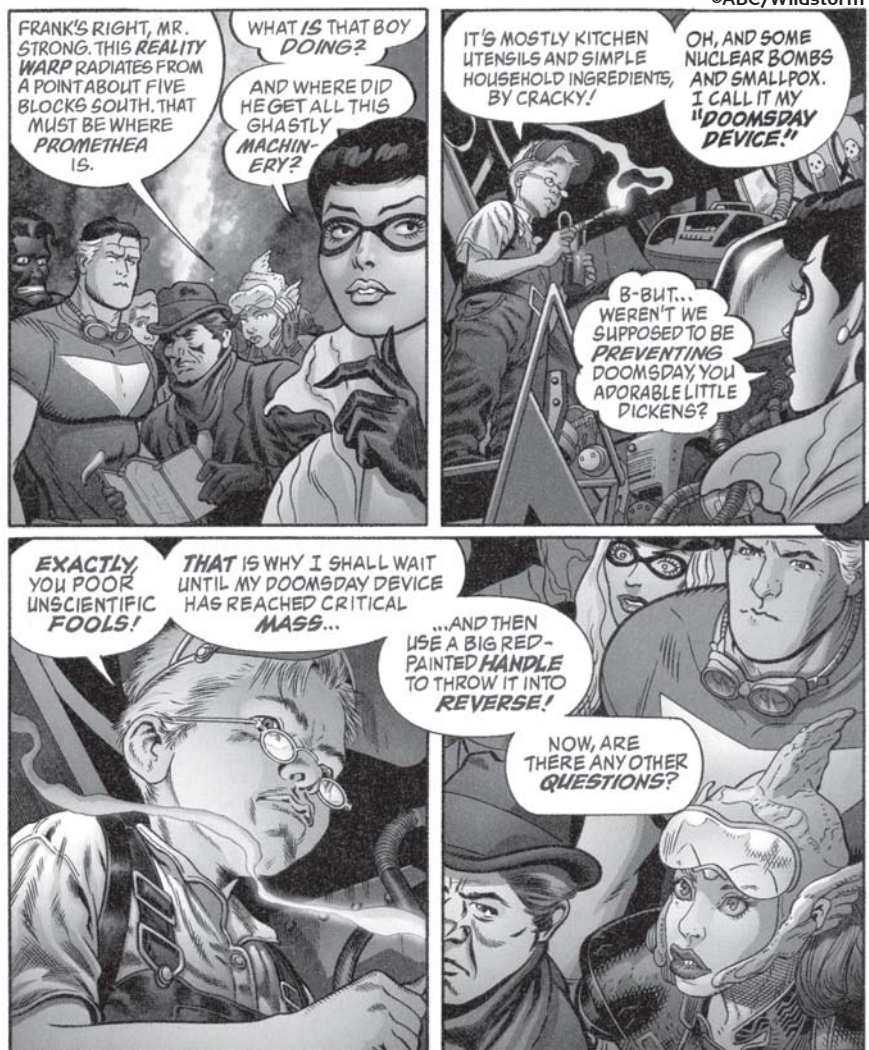
Prometheassa esiintyvät myös Mooren muut hahmot Tomorrow Stories -lehdessä.

Promethean skeemaan supersankarikuvio ei oikein luontevasti istu. Tuntuu siltä, että hän on kääraissyntä tarinansa supersankaripakettiin saadakseen sille mainstream-yleisöä. Tämän hän on myöntänytkin. Kompromissittomana tunnetulta auteur'ilta ratkaisu on omituinen - etenkin ottaen huomioon, että osaa Mooren lukijakunnasta saattaa supersankarigenre kovastikin vieroksuttaa.