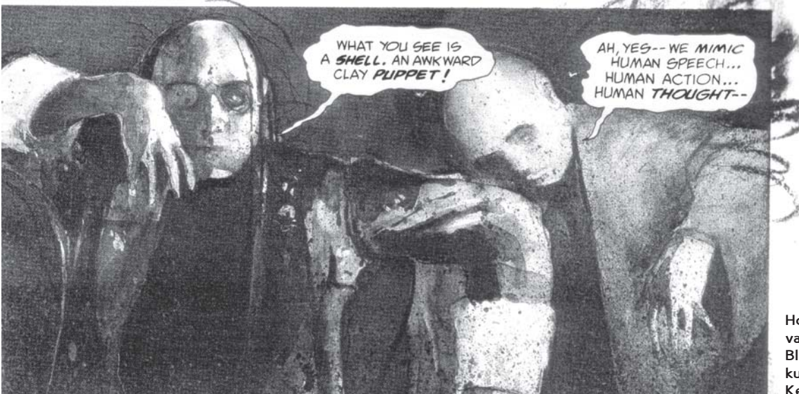
Houreinen vampyyritarina Blood, kuvittajana Kent Williams.