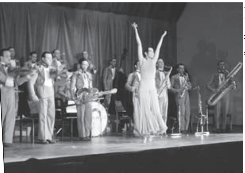
Rudolf Koivun kansikuva Garm n:o 21/1932. Josephine Baker esiintymässä Helsingissä jazz-yhtyeen kera joulukuussa 1933.