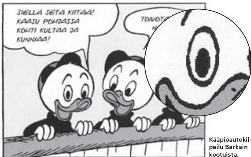
Kääpiöautokilpailu Barksin kootuista.

Nykyään lähes kaikki sarjakuvat Suomessa painetaan digitaalisesta materiaalis-