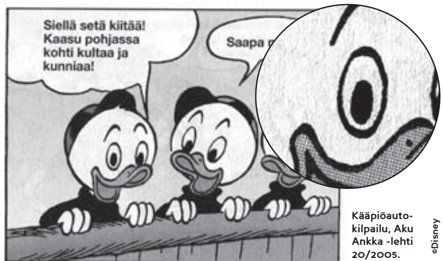
Kääpiöauto-kilpailu, Aku Ankka -lehti 20/2005.

Ei luulisi olevan ylivoimaista vaatia Tanskan Egmontilta, josta originaalimateriaali siis tulee, laadukkaammin skannattuja tiedostoja. Isompien datatiedostojen ei pitäisi lisätä kustannuksia nimeksikään. Jos Sanoma Magazines ei kykene saamaan parempaa materiaalia itselleen, eivät he voi myöskään luvata tilaajille huippulaatua, kuten Carl Barksin kootujen kanssa tekivät. Mikäli Sanoma Magazines ei ole aiemmin vaatinut tanskalaisilta parannusta asioihin, he joutuvat sen viimeistään nyt tekemään, jos vain lukijat jaksavat edelleen vaatia ja valittaa kehnosta laadusta. Ja mehän jaksamme ja vaadimme!