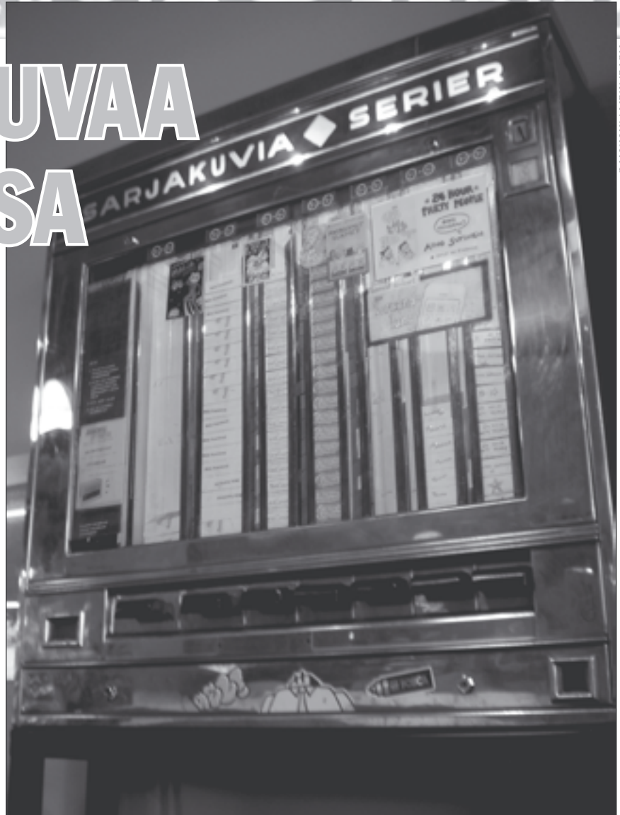
Kuva: Mari Ahokoivu

Kesellä Helsinkiä, Lasipalatsin Mbarissa, seisoo vanha automaatti täynnä pieniä elämyksiä. Entisessä 1940-luvun makeis- ja savuke-automaatissa on myynnissä sarjakuvalehtiä pakattuna tupakka-askin kokoiin pakkauksiin.