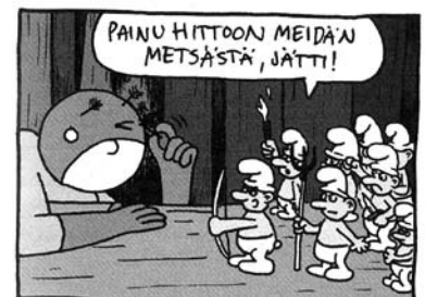
OTTO NUMERO 8 © JUSSI SALAKKA

Sympaattinen supersankari Otto kohtaa kahdeksannessa seikkailussaan muun muassa metsän pikkuväkeä, Strömssöjä. Matkalla kuljetaan autiomaiden ja musturimetsien läpi. Lopussa Otto kohtaa kadonneen toverinsa, Niinku-kissan. Napakka A7-kokoinen pikkuvihko on pienlehtihuumoria pätevimmillään.