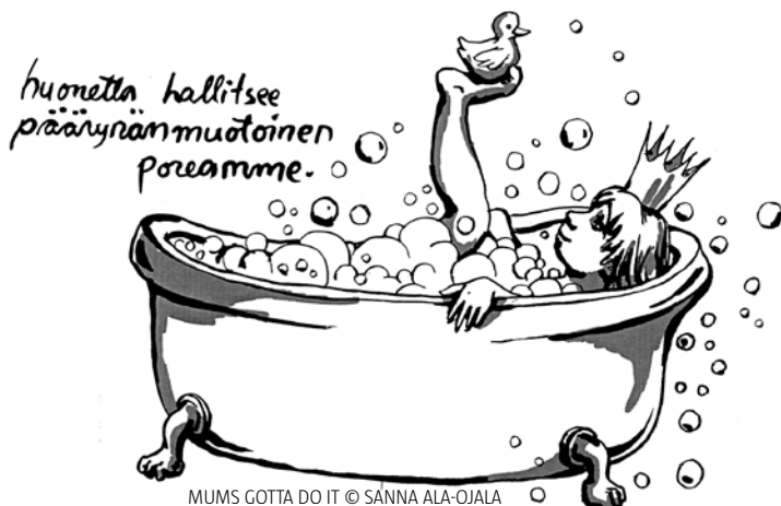
MUMS GOTTA DO IT