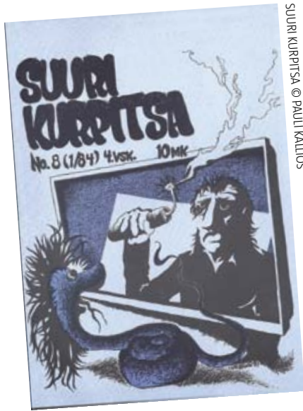
SUURI KURPITSA