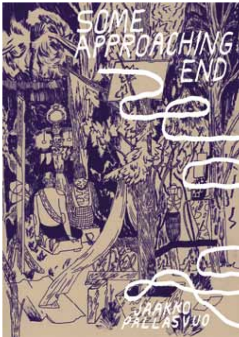
SOME APPROACHING END