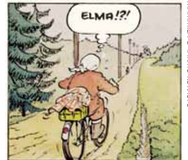
MÄMMILÄ

• Ehkä suurimman elossa olevan mangamestarin, Yoshiharu Tatumin urasta on tehty pitkä animaatioelokuva. Se on ohjannut Eric Khoo . Etenkin 1960–70-luvuilla mangailmaisua uudistanutta Tatumia ei tietenkään ole julkaistu meillä, mutta sentään animaatio esitetään Rakkautta ja anarkiaa-festivaalilla syyskuussa.