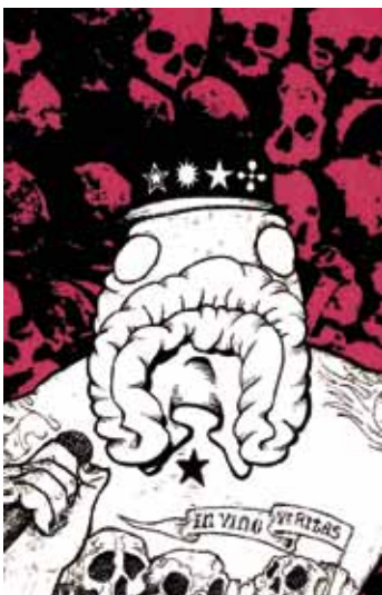
MY WAY, THE HARDCORE WAY © TUOMAS TIAINEN

Sarjakuva-automaattia varten tehty pikulipare herättää huomiota tyylikkäällä graafisella ulkoasullaan. Mustavalkojälkeä piristää sähkök pinkkitechosteväri. Hirviöpäiset jokamiehet kertovat positiivisista elämänmuutoksistaan katalogimainoksista ja laihdutustuotteista tulla tyyliillä. "Just four weeks after the Hardcore program I went from earning € 10 000 a month to earning € 10 000 a week." Enemmän tätä lukee kuin terminaitokapselimeinoksia.