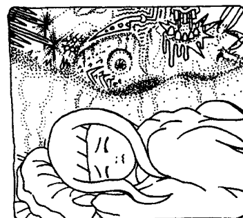
ATOMIDONITSI 1