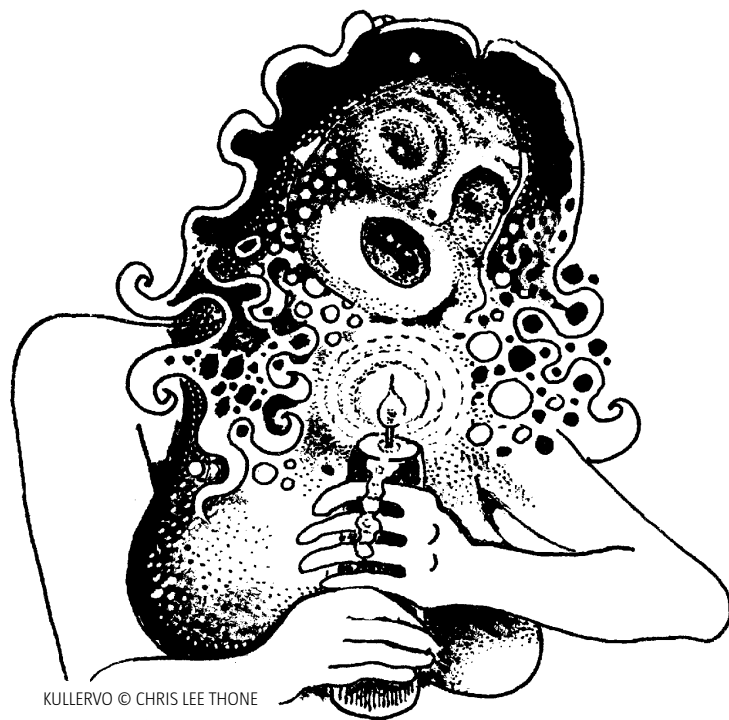
KULLERVO