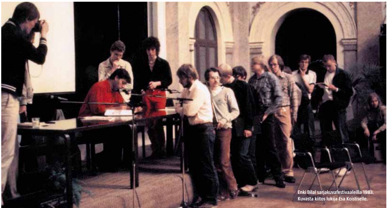
Enki Bilal sarjakuvafestivaaleilla 1983.