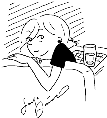
Solja Järvenpää Läänintaiteilija

O lisi hämmentävää jos vuoteen 2025 mennessä suomalaisella sarjakuvalla ei olisi omaa museota. Museon seurana olisi komea Sarjakuvakeskus ja laaja sarjakuvakirjasto. Tämä tosin vaatisi sitä, että sarjakuvataiteilijoiden ja alan toimijoiden apurahojen ja perusrahoituksen pitäisi olla kohdillaan. Toivoisin myös, että 2025 mennessä suomalaisen sarjakuvan ostajakunta lisääntyisi ympäri maailmaa, vaikkapa sähköisten kirjojen avulla. Tsemppi!