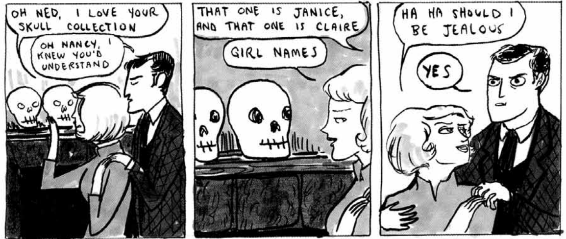
Neiti Etsivä, aina yhtä nokkelana.