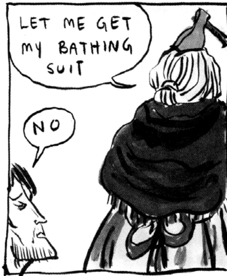
Syyllisyys piinaa Raskolnikovia.

M äärittelemättömässä lähi- menneisyydessä joku jakoi linkin sarjakuvavivustolle, jolla oli nokkelan ja van- hahtavan kuuloinen nimi. Ensimmäinen strippi ei ehkä auennut, vaikka teki- jä kohteliaasti kertoikin asiasta lisää sarjakuvan alla. Toinen linkitys tutumasta aiheesta ehkä hymyilytti. Kolmas saikin jo kahvit tirskahta- maan näppikselle: naisia heittävässä alushou- sussa Nikola Teslan keksintöihin, Raskolnikov nä- kemässä märkää unta tappamastaan muoris- ta, Robinson Crusoe mokeltamassa tyhmyyksiä Perjantaille .