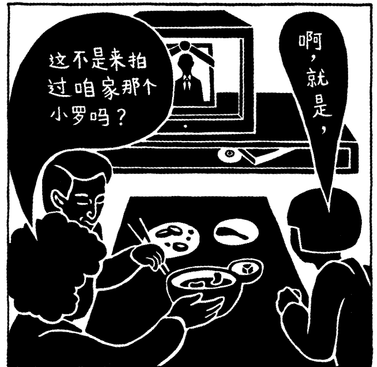
Special Comixin tyylikirjo on laaja. Manitu piirtää semioottisesti. Hänen tarinansa kertoo dokumenttielokuvien tekijän kuolemasta.