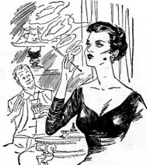
Tuntemattoman taiteilijan kuvitusta kirjaan "Seitsemännen lohikäärmeen veli".