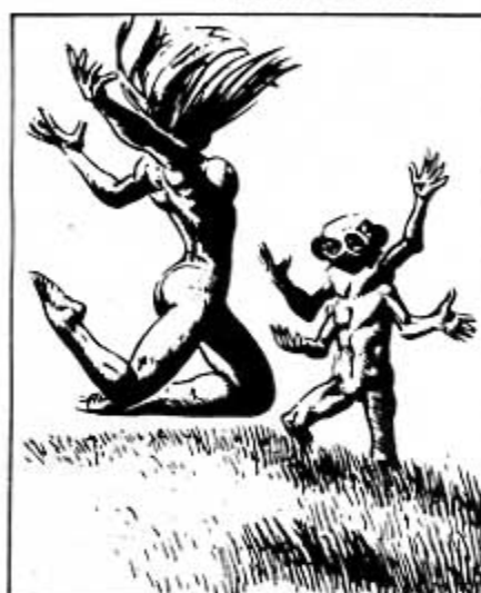
Twilight of the dogs