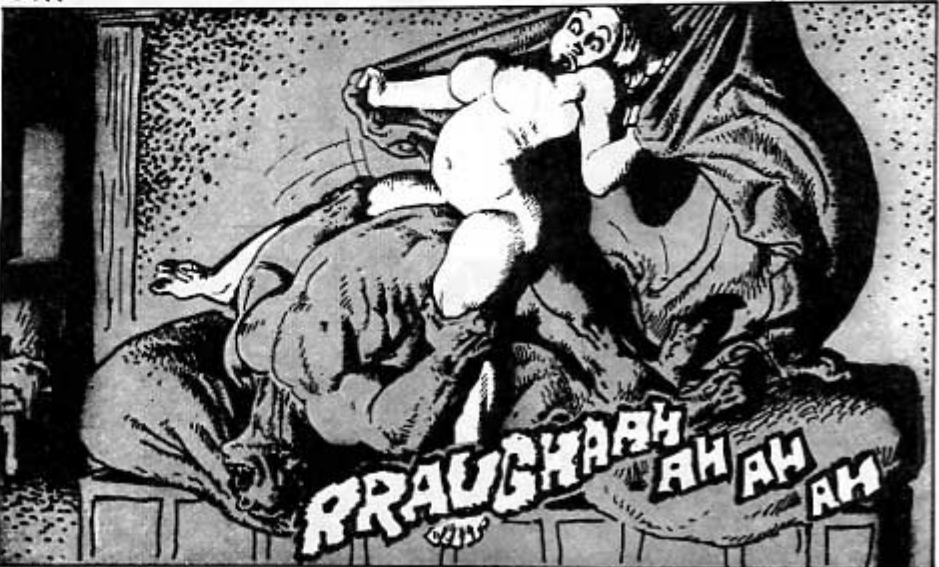
The Beast of Wolfton

veena sitä en tiedä, mutta ainakin Corben tuntuu niin uskovan. Esimerkiksi hänen Den-sarjansa kertoo pienestä hirtelästä insinööristä, joka eräänä päivänä rakentaa salaperäisen ohjeen mukaan eriskummallisen kojeen. Tuo sähkölaite toimii porttina toiseen ulottuvuuteen. Insinööri me siirtyy sinne ja muuttuu edelläesite-