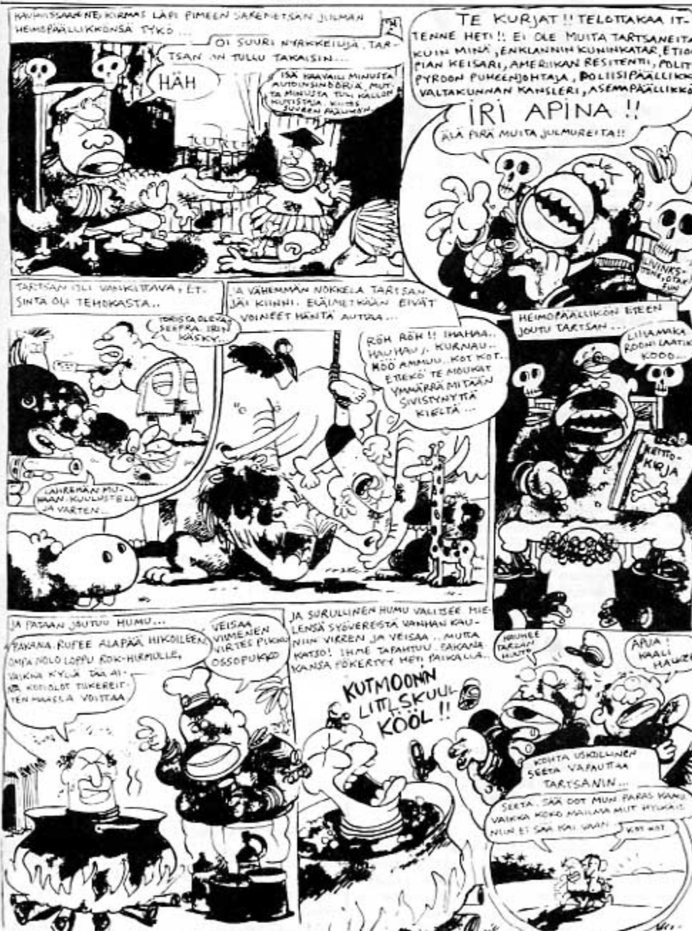
Nyrock Cityn hieno väritys näyttää tuhrulta mustavalkokopiosse. Tästä Remuterzen ja Cisseseeta seikkailevat Iri Apinan luona.