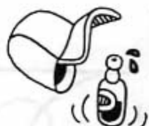
VAIMO = AKKA

HEIKKINEN HERROJEN PÄÄHÄNPOTKIMA PIENIVILJELIÄ - POKKANKKEITTÄJÄ, SUOMALAISEN KEHITYSALUEPOLITIIKAN RUUMIILISTUMA, PTAI- SIKO SANOJA ASTRALIAHÄMMÖ, LUOHDETTU YKSINÄISEN RATSASTAJA, JONKA JUURET OVAT SYVÄLLÄ PAKETTITELLOSSA, LÄISKÄNSUUTTIKKA VASTARUUNANKIKISKI, ELÄMÄNPUITTEET AKKA JA YHDEKSÄN (KÄSIVÄÄ MÄÄRÄ) LASTA, TIETOMYYS, POTKANKKEITTO, PAKETTITELTOVILJELI, SEKSILEDDET, KESKIOLUT, LOTTO, BINGO TMS.