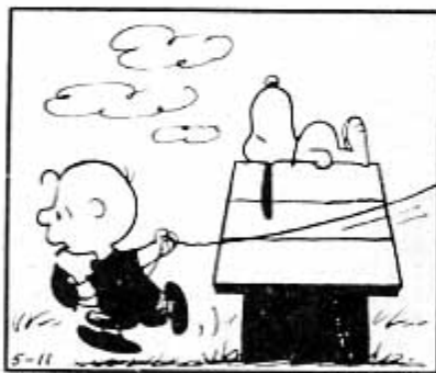
TENAVAT Charles M. Schulz