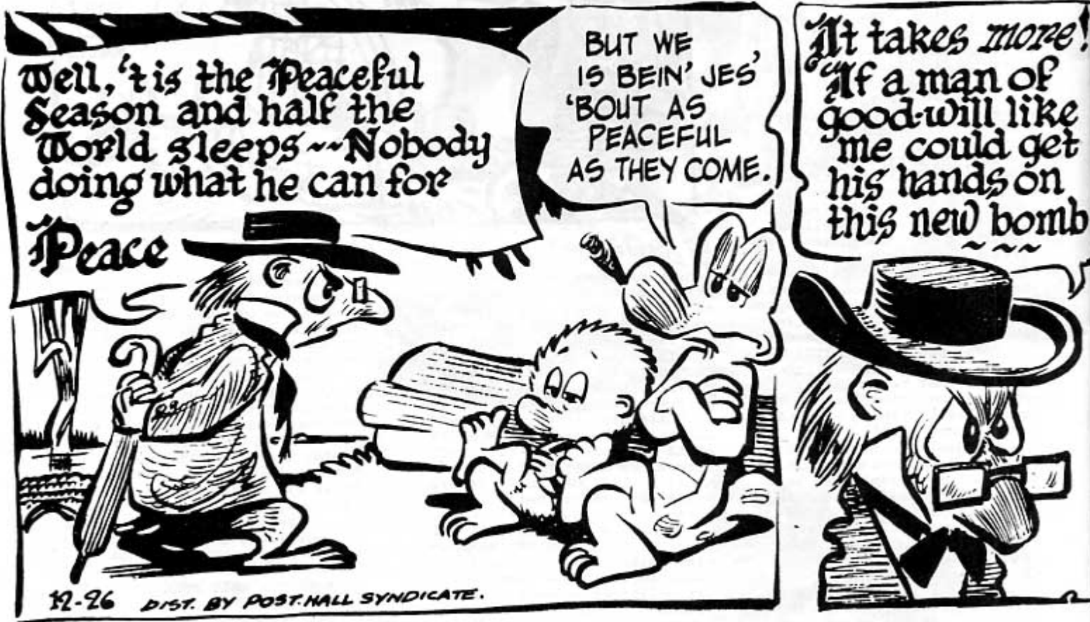
Deacon Mushrat uhkailee pommilla niitä, jotka eivät tee rauhantyyötä.

Ikiomista Pogo-kirjoistani voisi aloittelevalle Pogo-lukijalle suositella kolmesta aiemmin julkaistusta kirjasta (The Pogo Stempmother Goose, The Pogo Peek-A-Book, Uncle Pogo So-So Stories) koottua teosta nimeltä A Pogo Panorama. Syystä, että ko.