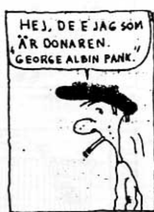
Christian Sund: Skaparens gärningar