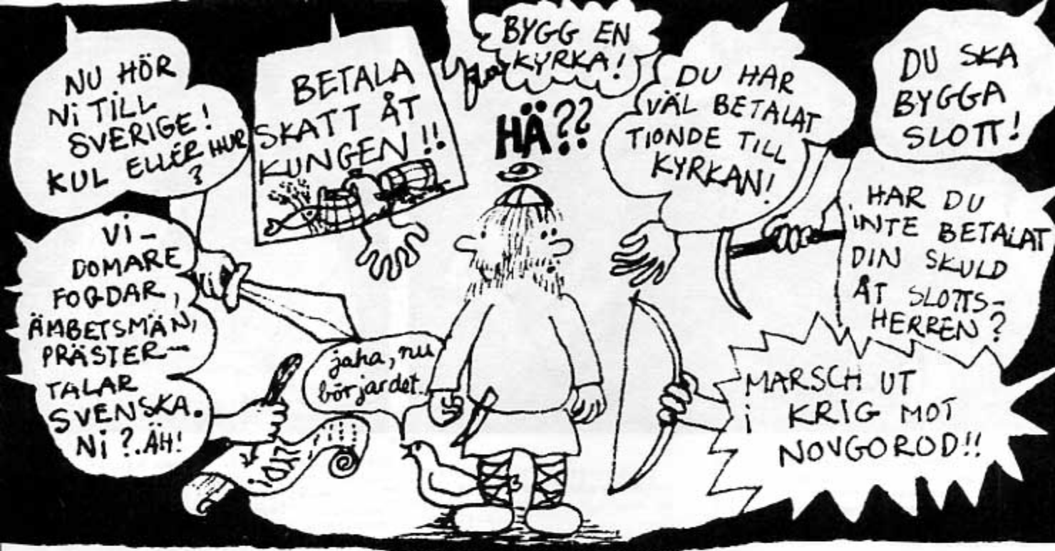
Antonia Ringdöm: Om Finlands historia