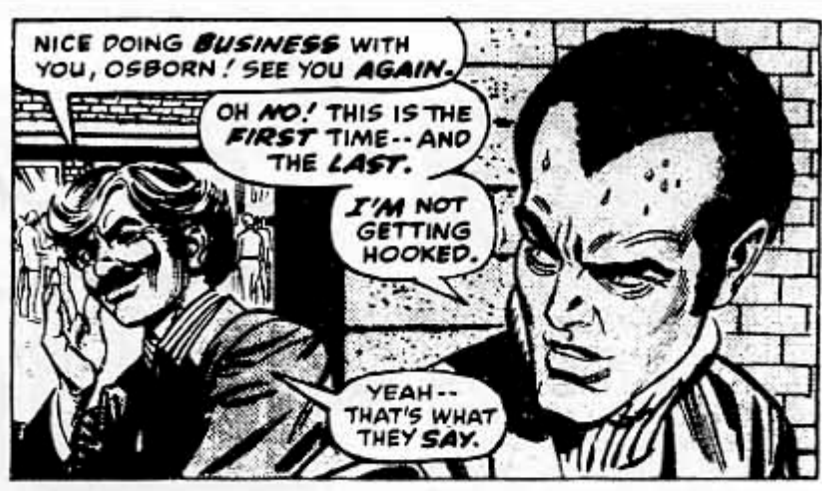
TÄMÄ OLI LIIKAA COMICS CODE -SYSTEMILLE YHDYSVALLOISSA V. 1970. HARRY HUUMETROKARI AUTTAA HARRYA. AMAZING SPIDERMAN 97.

Näiden kahden lehden mainokset koostuivat eri alkoholijuomien, moottoripyörien, stereolaitteiden ym. aikuisille tarkoitettujen tavaroiden mainoksista. Jälkimmäisestä lehdestä, joka siis ilmestyi coden leimalla varustettuna, löytyi jopa hieromasauvamaanos.