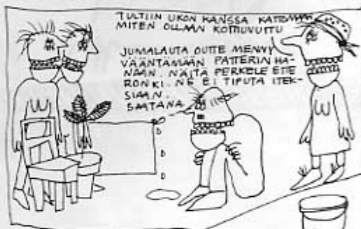
Vuokralaisten elämän onkusta. Sarja "Vaikeat vuokralaiset".