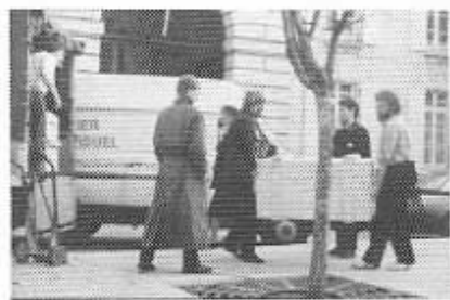
Näyttely saapuu, vibdoinkin.