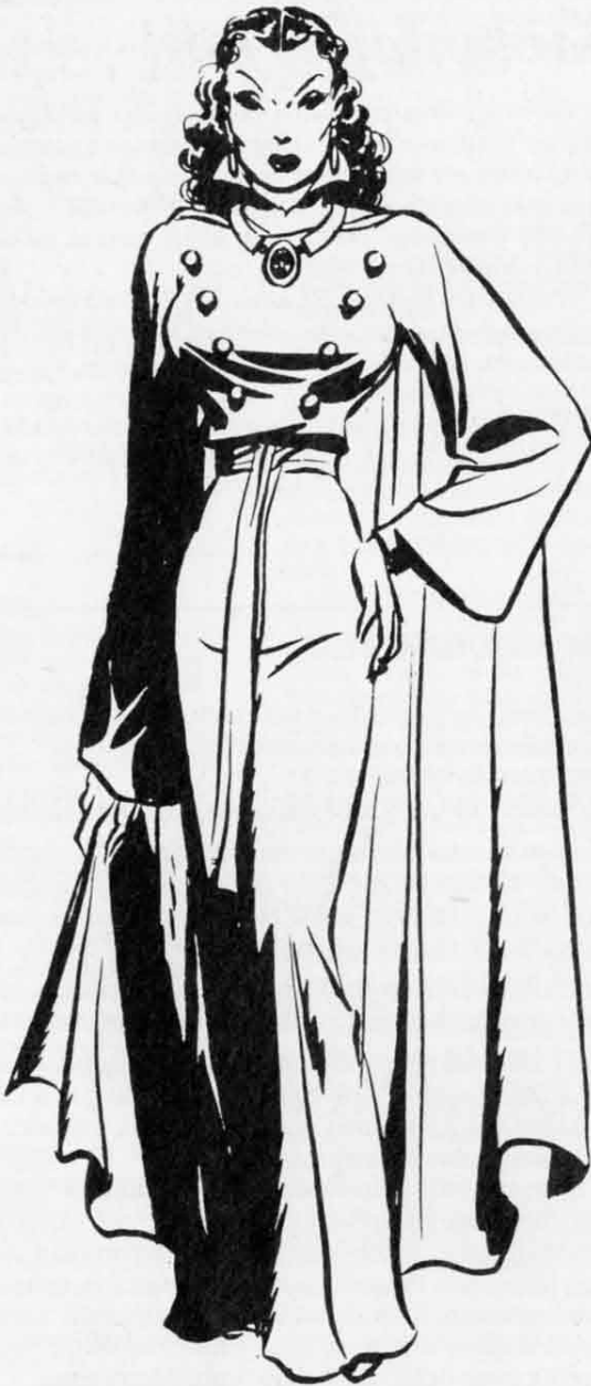
The Dragon Lady