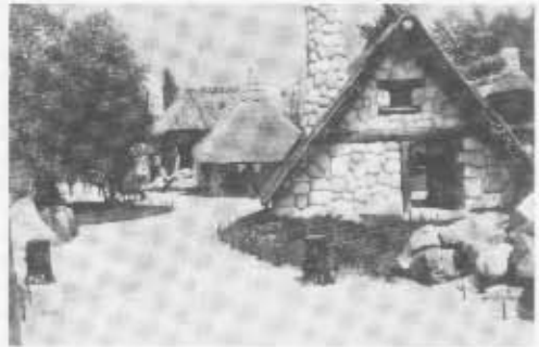
Gallialaiskylä, jossa voi kävellä ja katsella majoissaan mekaanisesti byöriviä sankareita.