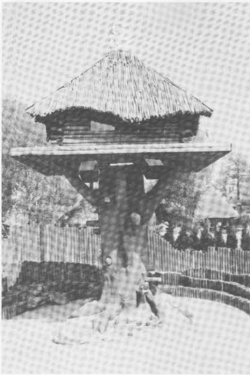
Bardi Trudurixin koti.