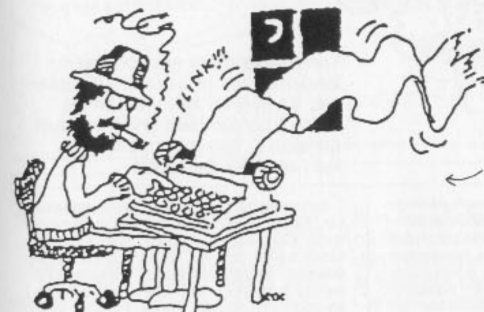
Rune T. Kidde'n pürros artikkelin kirjoittajasta Jørgensenistä

Piirroksat ovat taiteilijoiden omakuvia!