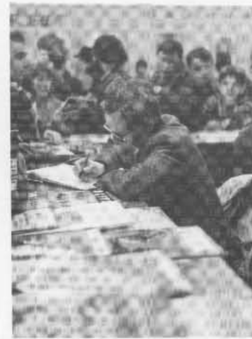
Pöytä on pirstaa.