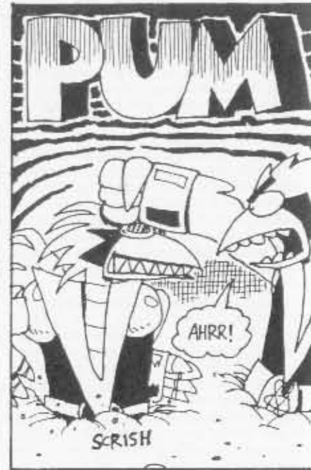
Fission Chicken (oikalla) tappelee pahan kaksoisolentonsa kanssa.

Kun jälleen uusi hirviö uhkaa Neekburgia FC syöttää tälle kaikki toillisuuden ongelmajätteet, mutta hirviö ei ole moksiskaan. FC lennättää paikalle rekka-autollisen McDungalin hampurilaisia ja tyhjentää lastin hirviön ki-taan. Hirviö kuolee kamalien äänitehosteiden säästyksellä vatsavaivoihin.